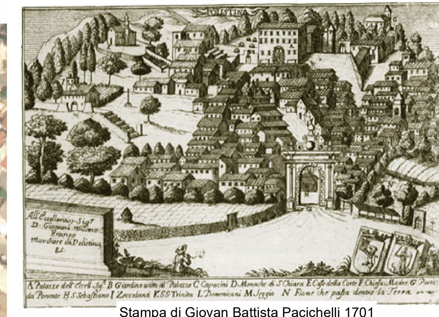
Stampa di Giovan Battista Pacichelli 1701