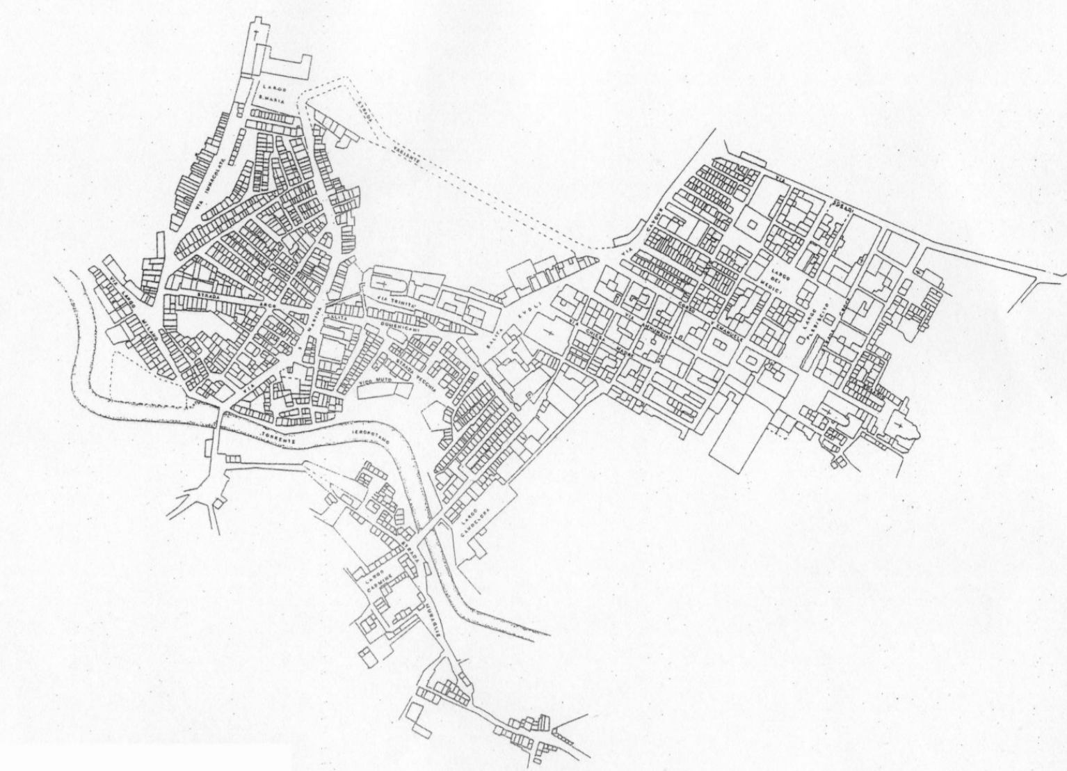
Archivio di Stato di Reggio Calabria: Rilievo di Polistena 1878